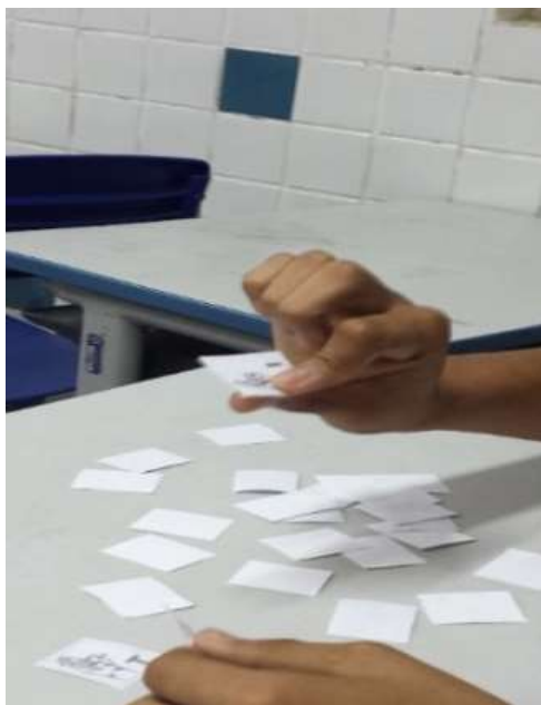
Imagem 1 – Jogo da memória

Para o Estudante A, em questão, algumas atividades foram propostas, como o alfabeto por meio de letras móveis (sinal e letra), os animais através de um jogo de dominó e o corpo humano por intermédio do jogo da memória. Além dos jogos (bingo, jogo da memória, dominó etc), atividades “xerocadas” através da associação da escrita, sinal e figura também foram utilizadas. O método de associar esses três fatores: escrita, sinal e figura é necessário para a memorização das palavras trabalhadas.