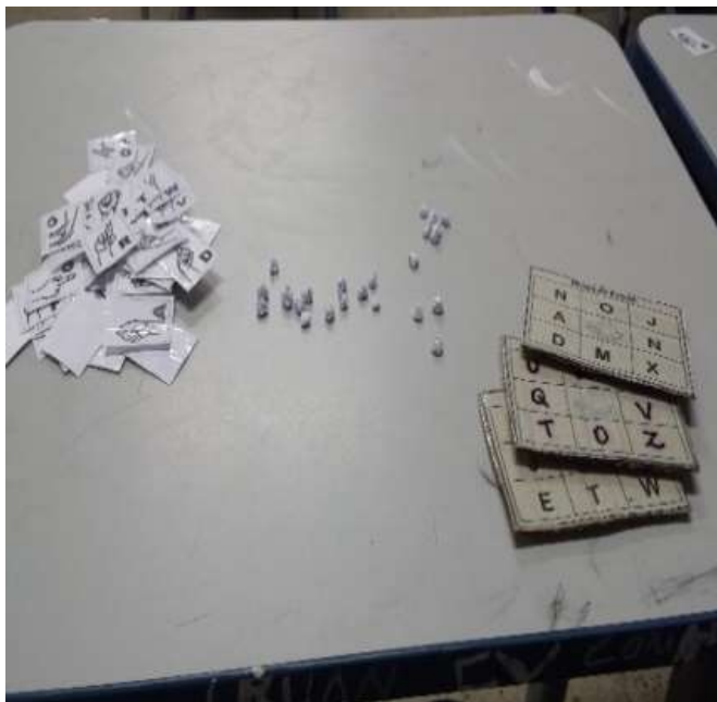
Imagem 2 – Letras móveis e Bingo

A OBSERVAÇÃO PARTICIPANTE DO ESTÁGIO NÃO OBRIGATÓRIO: