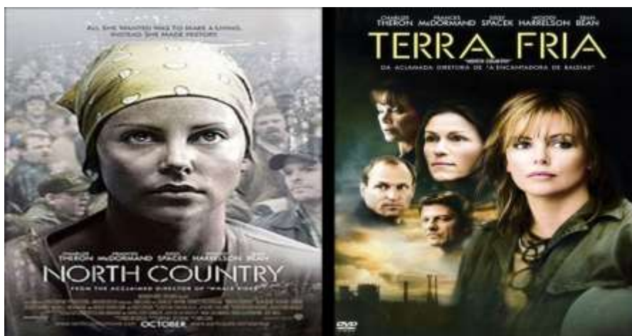
(Terra Fria, Niki Caro, 2005/Capa Americana e Brasileira)

Para o segundo tema, decidimos abordar a questão de gênero, discutindo as transformações do papel da mulher em nossa sociedade. Começamos pelo filme “Terra Fria” (2005).